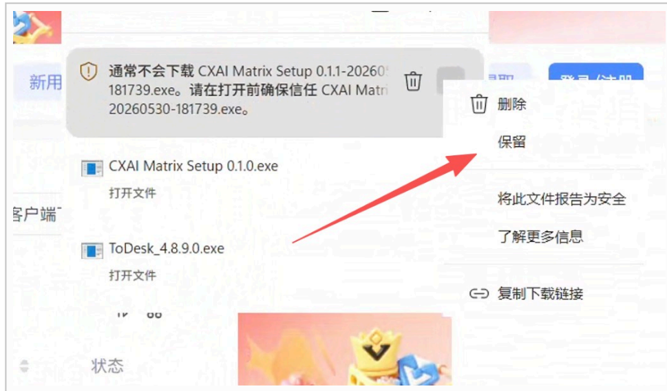
▲ 图 1：下载列表 → 「…」 → 「保留」