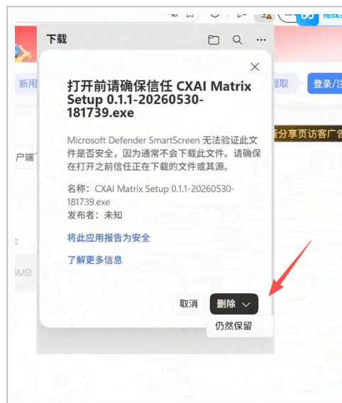
▲ 图 2：确认窗 → ▼ → 「仍然保留」